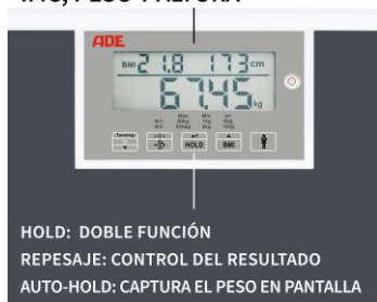
EN UNA VISTA IMC; PESO Y ALTURA