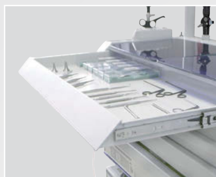
MESA DE TRABAJO EXTRAIBLE