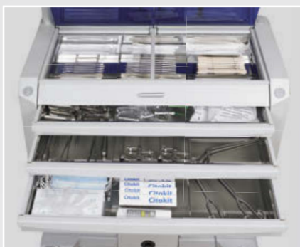
CAJONERAS DE GRAN CAPACIDAD