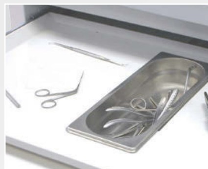
CUBETA DE ACERO INOXIDABLE PARA INSTRUMENTAL USADO